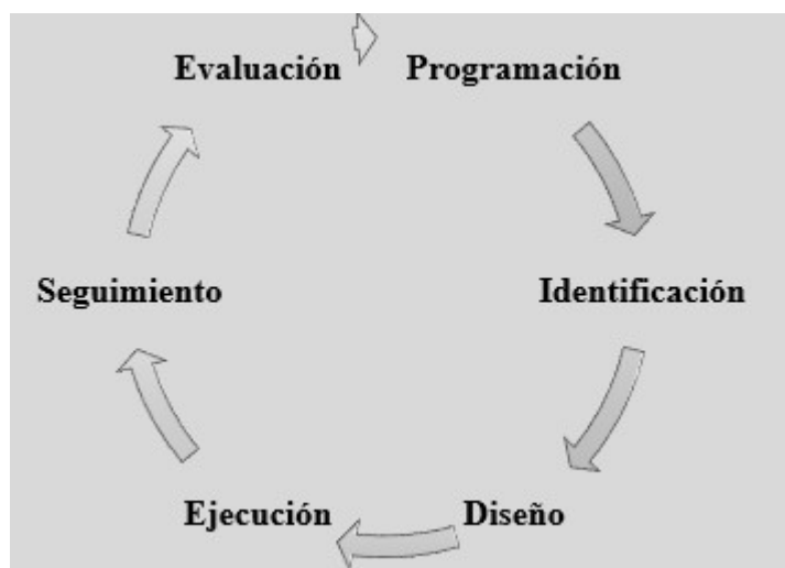
Cuadro 4 - Administración General del Estado